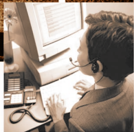
Monitoreo de emergencia las 24 horas del día