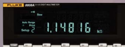
Configure la realización de seis medidas comunes mediante los botones del panel frontal y a continuación pulse la tecla adecuada para realizar cada una.