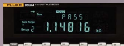
El modo de comparación de límites con indicadores "pasa / no pasa" puede ayudarle a eliminar los errores de producción.