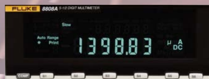
El 8808A puede medir pequeñas corrientes de fuga con una resolución de hasta 100 nA, sin cargar el circuito bajo comprobación.

Independientemente de si está realizando pruebas funcionales o medidas críticas en puntos de comprobación, si utiliza el modo de comparación de límites con indicadores "pasa / no pasa", eliminará los errores de producción, especialmente aquellos en los que los resultados son críticos. La pantalla del 8808A dispone de indicadores que muestran claramente si una prueba es apta o no. Los indicadores "pasa / no pasa" acaban con cualquier incertidumbre: el resultado está dentro o fuera de los límites.